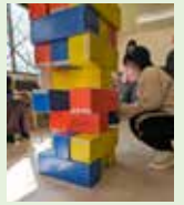
巨大ジェンガ おっつとつと