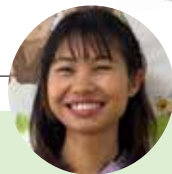
オンマーさん 2024年入職