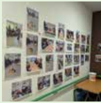
10年を振り返る写真展。見応えあり！