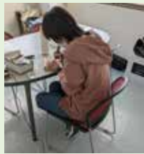
私たちは ノッポさん世代