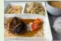
楽しい&美味しい 調理プログラムの ハンバーグ！